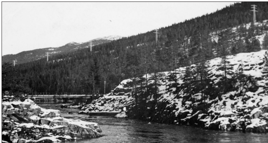
Kulturminne kan vere så mangt. Noko kan berre takast vare på i fotografisk form. Krigs- og kulturminnet som høgspentlina frå Rjukan til Herøya utgjer, blei delvis fjerna for nokre år sidan. Bildet er tatt frå utløpet av Sønndalsvatnet. Vi ser også ei gammal bru som også er borte.

- Oppstartmøte for arbeidsgruppa for kulturmiljøplan blir halde torsdag 3. juni. Historielaget har med tre deltakarar.