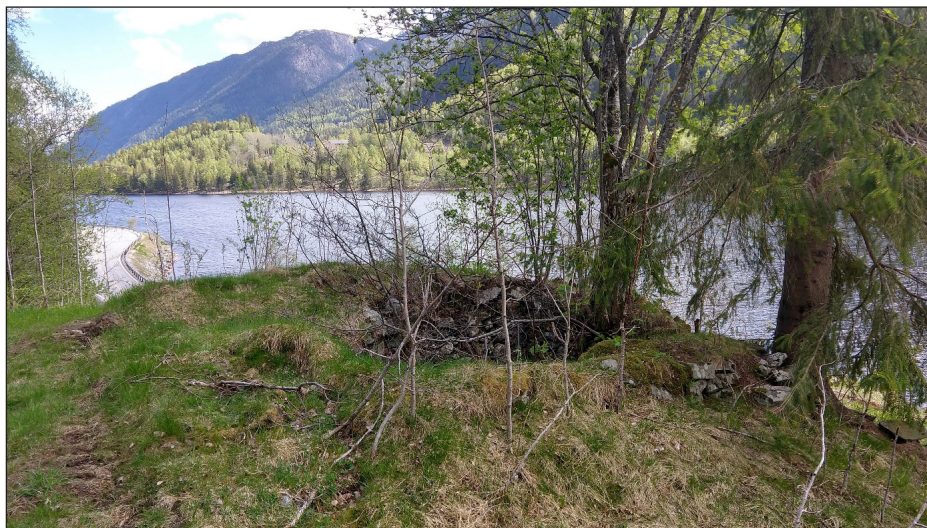
Rester av tidlegare husmannsplass ved Hjartsjøvatnet.