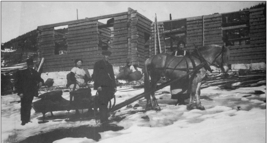
Det tok tid å komme i gang med arbeidet på Bergtun, men kanskje hjelpte det med eit lesarinnlegg. Her er i alle fall bygginga komme langt