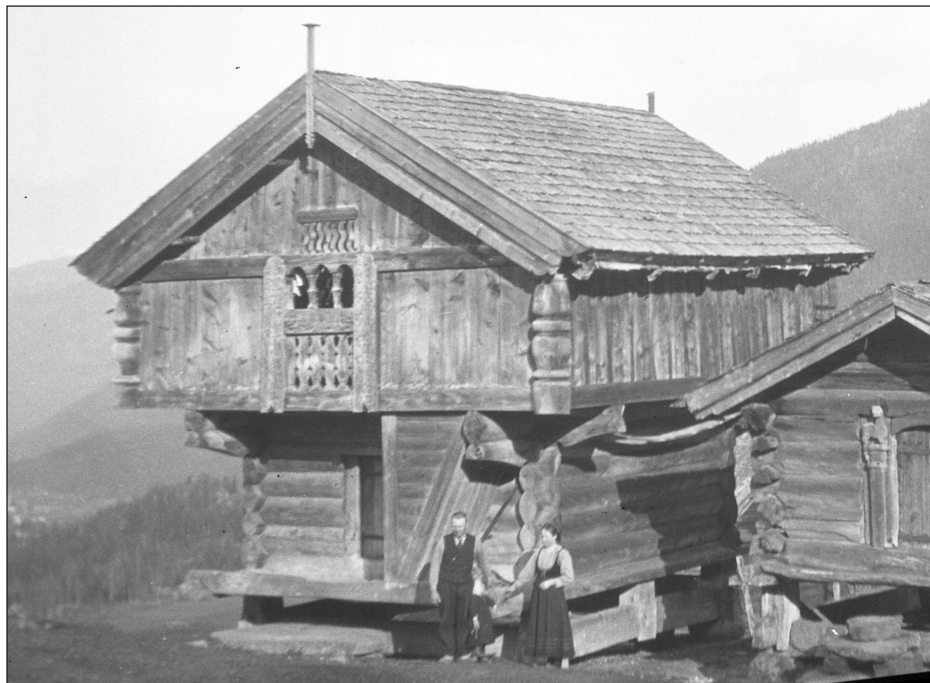
Den freda garden Sud-Aabø er eit verdifult kulturminne med fleire svært gamle bygningar.

- Oppslag i Telen om blankt avslag frå kommunen.