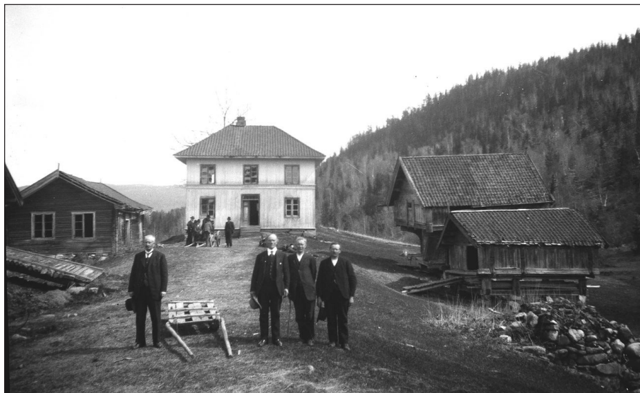
Garden Tjønnås var kommunal eigedom ein periode. Da var det på tale å opprette landbrukskule for fjellbygene der. På bildet er det politikarar som har stilt opp til fotografering på tunet.

Lensmanden spurde korleis han skulle med: dei private bilane som bad um å køyra upp til hotellet um sumrane. Fyr hadde han gjeve dei