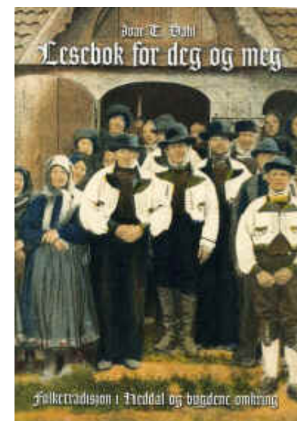
Lesebok for deg og meg

Dette er tredje og siste boka i det dokumentariske praktverket om hjartdalsbygdene - før i verden. Bøkene har blitt til for at den rike, folkelege kulturarven og