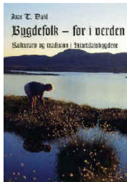
Kulturarv og tradisjon i hjartdalsbygdene

Den rikt illustrerte boka med bilde frå 1880-2003, tar deg med tilbake til ei anna og ukjent verd – "før i verden." Kan hende finn du