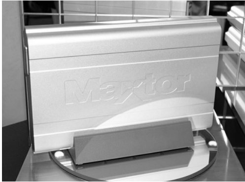
Maxtor ekstern harddisk

Når det gjeld datamaskinen er dette løyst på ein ganske praktisk ny måte. I motsetning til i tidlegare tider er det nå datamaskinar tilgjengeleg både her og der - dvs i dei fleste heimar og på alle kontor. Desse blir også fornya etterkvart som standarden krev det. Derfor er