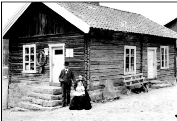
Frå utstillingen: Utanfor butikken i Mosebø

Ei grei omtale på førehand i Telen, gjorde nok sitt til at også ein del utanbygds gjesta utstillinga. Vi såg også med glede at ein samlingsstad som dette var ein populær møteplass for folk som hadde noko å prate om innan bilde og gamle minne. Mange brukte lang tid i lokalet både til å sjå på bilde og til å snakke med kjende og ukjende med same interesse for fortid og nåtid.