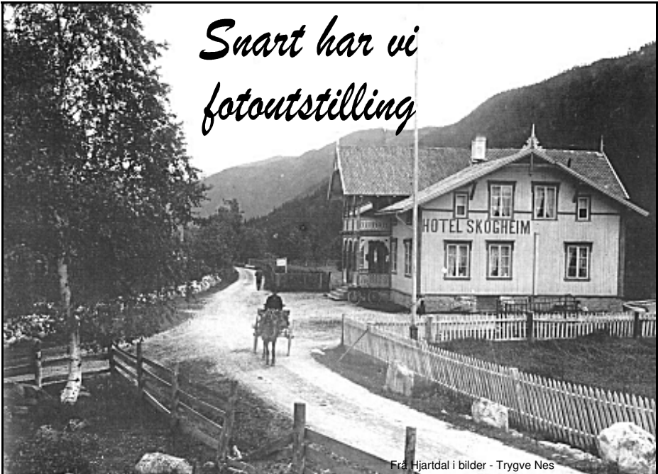
Frå Hjartdal i bilder - Trygve Nes

Arbeidet med fotoutstillinga har komme eit godt stykke vidare i vinter. Avtale er gjort med forograf Mæland i Bø. Han skal lage bilda ferdig innramma. Vår jobb er å plukke ut bilder som skal vise ein del av utviklinga i bygdene våre frå slutten av 1800-talet og fram til nå ved årtusenskiftet.