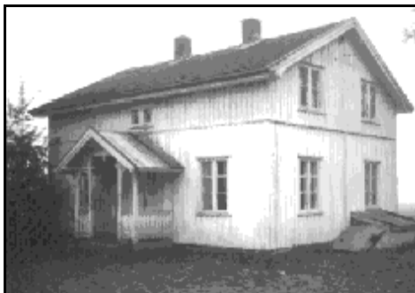
O.Lias hus i Sauland var det første

På mindre stader blir kvar enkelt institusjon enda viktigare for innbyggjarane enn i ein større by. Vi er få her i bygdene som ikkje har eit forhold til banken. Og vi ser han som eit sjølvstøtt innslag i bygda, som posthus, kommunehus, skular og butikkar. Lett er det å tenke seg ulempene om ein for kvar tur i Hjartdal og Gransherad sparebank skulle måtte køyra dei to mila ekstra til Notodden. Eller kva med det å alltid treffe kjentfolk både framfor og bak skranken?