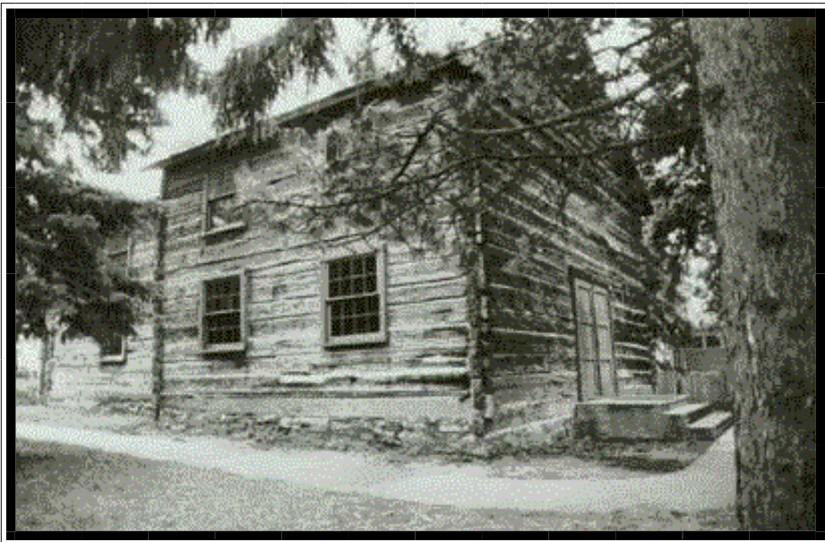
Det er på tide at hjartdølar får sjå dette utvandrarhistoriske klenodiet i St. Paul, Minnesota.

Likevel utvikla staden seg, og folk fann seg etter nokre år råd til å byggje ei meir moderne kyrkje. Da forfall den gamle kyrkja og blei ei stund bruka som stall og grisehus inntil ein historikar oppdaga dette, og sette igang ein redningsaksjon. Dette førde til at kyrkja blei restaurert, men flytt til ein park ved det norske presteseminar - Luther Seminary, i St. Paul i Minnesota. Der står ho i dag og blei i haust besøkt av dei som planlegg bankjubileumsturen.