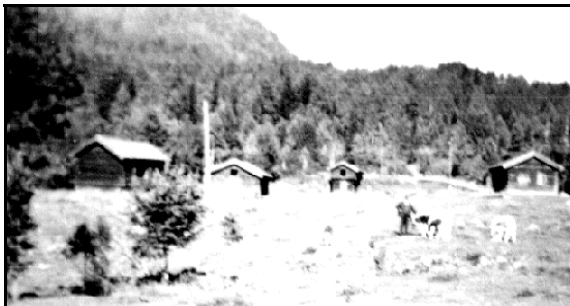
Frå plassen Maurebrekke i Bøegrenda i Sauland.

Alle med litt interesse for lokalhistorie er merksame på at vi har eit førsteklasses grunnlagsmateriale for å lage eit kart over husmannsplassane i bygda. Eg tenker her på Hjartdalssoga. Her er alle plassar omtala, og alle dei som har budd på plas-sen er nemnde så sant det finst eit aldri så lite skriftleg spor etter dei i kjeldene. Om vi så tar for oss registeret bak