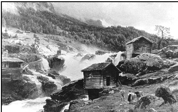
Omnesfossen måla av Hans Gude i 1859

Vi har elles nå bestemt oss for å legge arbeidet på is. For ikkje lenge sidan har vi fått vite at det er andre, private interesser som har søkt eigaren - Notodden kommune om å få pusse opp mølla og bruke ho for lengre tid framover. Det er ikkje ønskeleg for oss å konkurrere om mølla. Ut frå vårt interesseområde meiner vi da i staden å kunne be Notodden kommune stille visse vilkår overfor leigaren. F.eks. må dei vernemessige sidene ved bygget og området bli sikra ved ei evt. langtidsutleige eller salg av bygget.